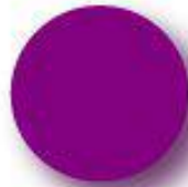
Magenta Pantone 254 C