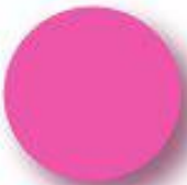
Pink Pantone 232 C