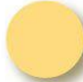
TC Pantone 1345 C