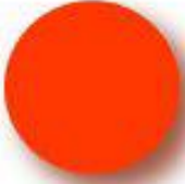
Light Red Pantone 179 C