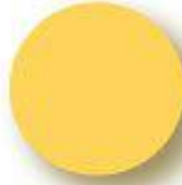
Dark Yellow Pantone 1225 C