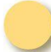
TC Pantone 1345 C