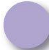
Daylight Pantone 2708 C