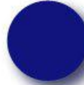
Dark Blue Pantone 072 C