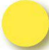
Yellow Pantone 114 C