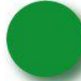
Green Pantone 355 C