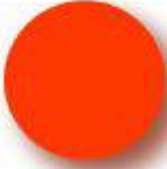
Light Red Pantone 179 C