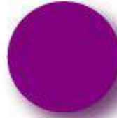
Magenta Pantone 254 C