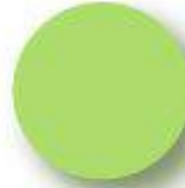
Light Green Pantone 367 C