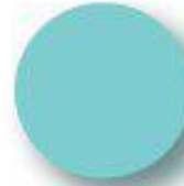
Light Cyan Pantone 305 C