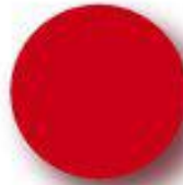
Red Pantone 187 C