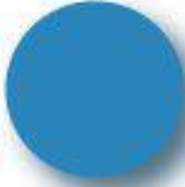
Cyan Pantone 2925 C