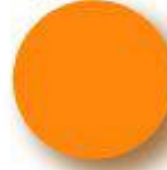
Orange Pantone 151 C