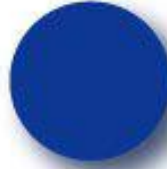
Blue Pantone 286 C