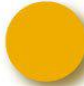
Light Orange Pantone 124 C